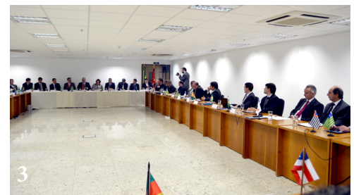
PGR participou de reunião com representantes dos Ministério Públicos Estaduais

Com a presença do procurador-geral da República, Rodrigo Janot, o Conselho Deliberativo da CONAMP reuniu-se em Brasília para debater a unidade entre os ramos do Ministério Público e o combate à corrupção . O PGR destacou o potencial de mobilização dos MP's estaduais e afirmou que trabalha pelo fortalecimento da unidade ministerial. A CONAMP defendeu o diálogo institucional, sugerindo ao PGR ações de aperfeiçoamento do relacionamento entre os ramos do MP brasileiro.