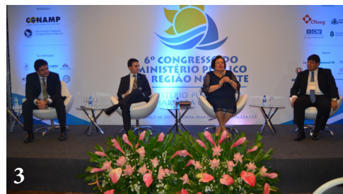
1. Solenidade de abertura do 6º Congresso Regional do MP 2. Ministra Carmen Lúcia do STF durante o congresso 3. Lançamento do XXI Congresso Nacional do MP

De 4 a 6 de março, a CONAMP e a Associação Cearense do MP (ACMP) promoveram o 6º Congresso Regional do MP da Região Nordeste . Com o tema “Ministério Público: um olhar para o futuro”, o evento ocorreu em Fortaleza (CE) e reuniu promotores e procuradores de Justiça de todo Brasil.