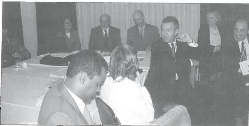
Reunião de Diretores e Representantes de Escolas ou Centros de Aperfeiçoamento do Ministério Público