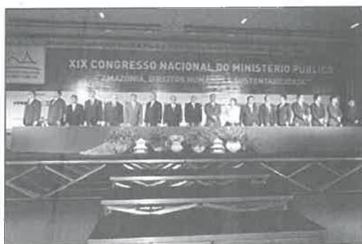
Mesa da Abertura do Congresso

O elevado nível dos palestrantes aliado à grandiosidade do Centro de Convenções de Belém, sem dúvida um dos melhores e mais equipados do Brasil, garantiram um evento que ficará marcado como um dos melhores já realizados no Brasil.