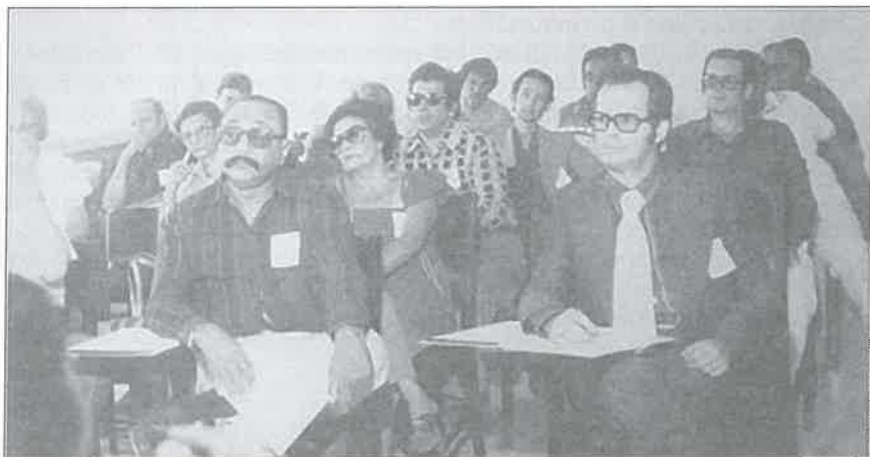
Aprentação de trabalho congressual em uma das salas do Congresso