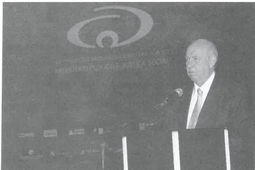
Vice-Presidente da República, José Alencar Gomes da Silva, no exercício da Presidência, quando do encerramento do Congresso

O Vice-Presidente da República, o industrial José Alencar Gomes da Silva, que à época estava no exercício do cargo – visto que o Presidente da República estava em viagem ao exterior –, fez questão de comparecer à solenidade de encerramento do Congresso. Lamentou sua ausência na abertura do evento, mas disse fazer questão de participar do momento de seu fechamento, pelo respeito e admiração que sempre teve pela nossa Instituição, em face dos amigos que tem no Ministério Público de Minas Gerais e pelo orgulho de ver que mais uma vez Minas acolhe um Congresso Nacional da Instituição.