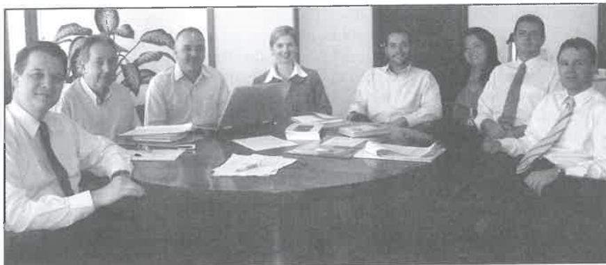
Comissão Organizadora do XVIII Congresso Nacional