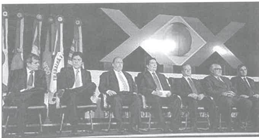
Solenidade de Abertura do XX Congresso Nacional do Ministério Público

Dessa forma, é possível que, com o seu não comparecimento, ela tenha, apenas, procurado evitar possíveis situações de constrangimento.