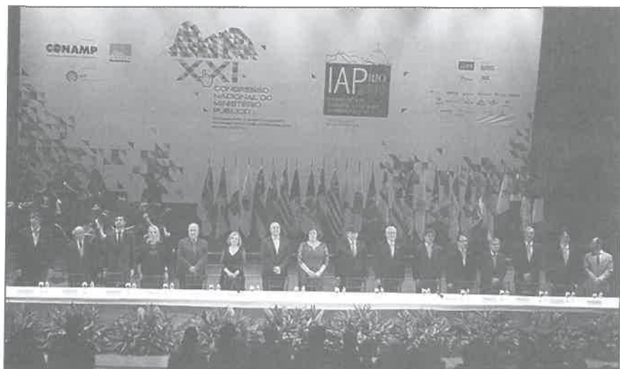
Mesa de autoridades em cerimônia de abertura no Theatro Municipal