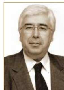
Luiz Antônio Fleury Filho (SP)